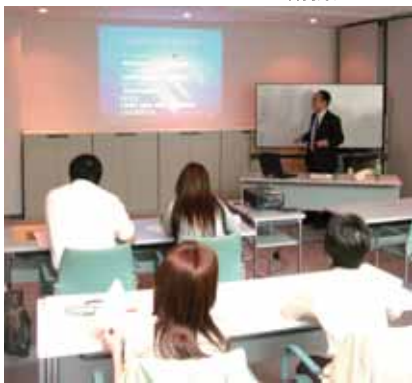
講義、デモンストレーション

○靴販売店にお勤めで靴調整を始めたい方 ○靴関連商品開発担当者 ○フットケアや靴調整に興味のある方