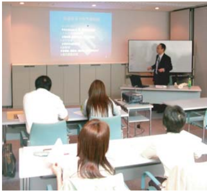
講義、デモンストレーション

○靴販売店にお勤めで靴調整を始めたい方 ○靴関連商品開発担当者 ○フットケアや靴調整に興味のある方