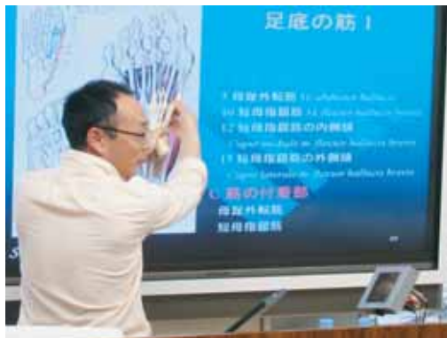
講義、デモンストレーション