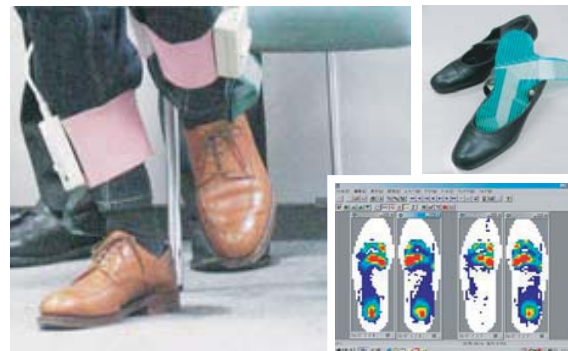
足圧分布測定システム(F-スキャン)測定実習