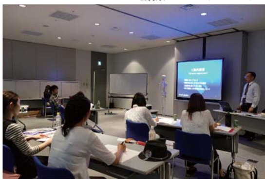
講義、デモンストレーション

○靴販売店にお勤めで靴調整を始めたい方 ○靴関連商品開発担当者 ○フットケアや靴調整に興味のある方