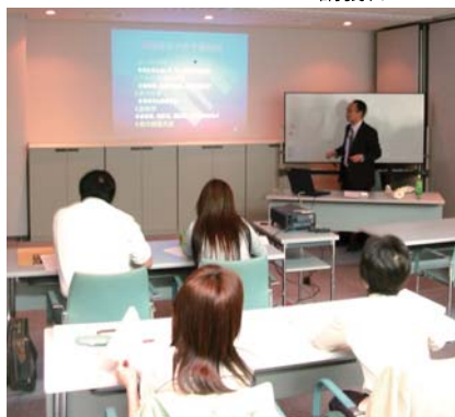
講義、デモンストレーション

○靴販売店にお勤めで靴調整を始めたい方 ○靴関連商品開発担当者 ○フットケアや靴調整に興味のある方